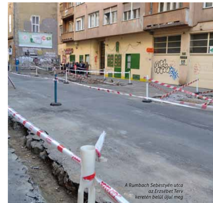
A Rumbach Sebestyén utca az Erzsébet Terv keretén belül újul meg