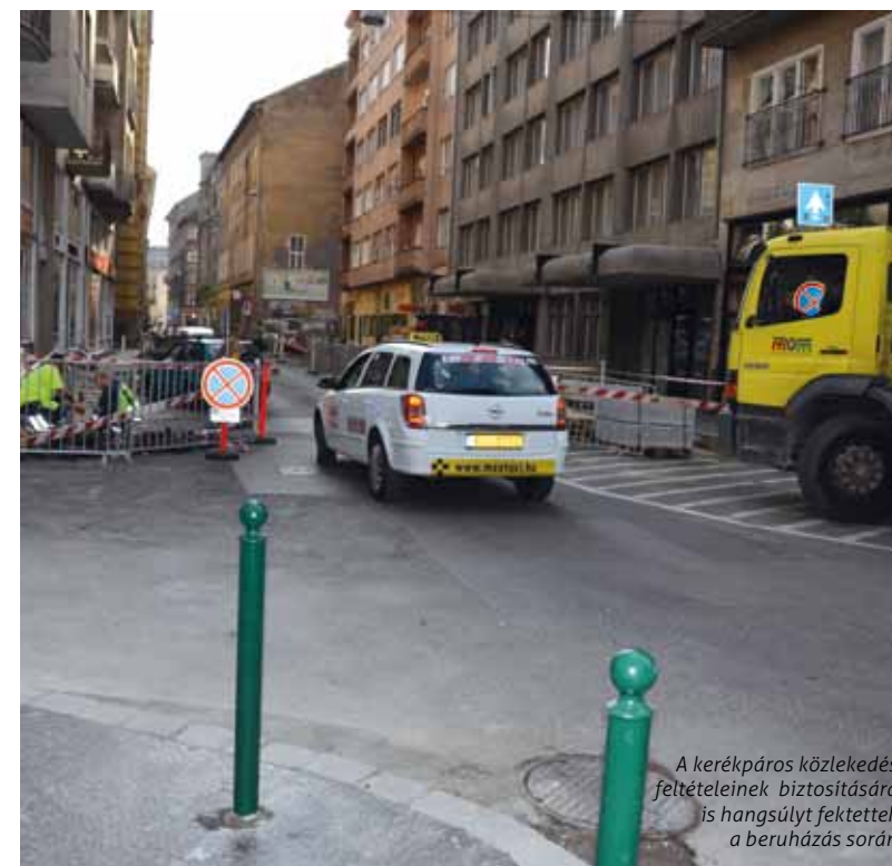
A kerékpáros közlekedés feltételeinek biztosítására is hangsúlyt fektettek a beruházás során