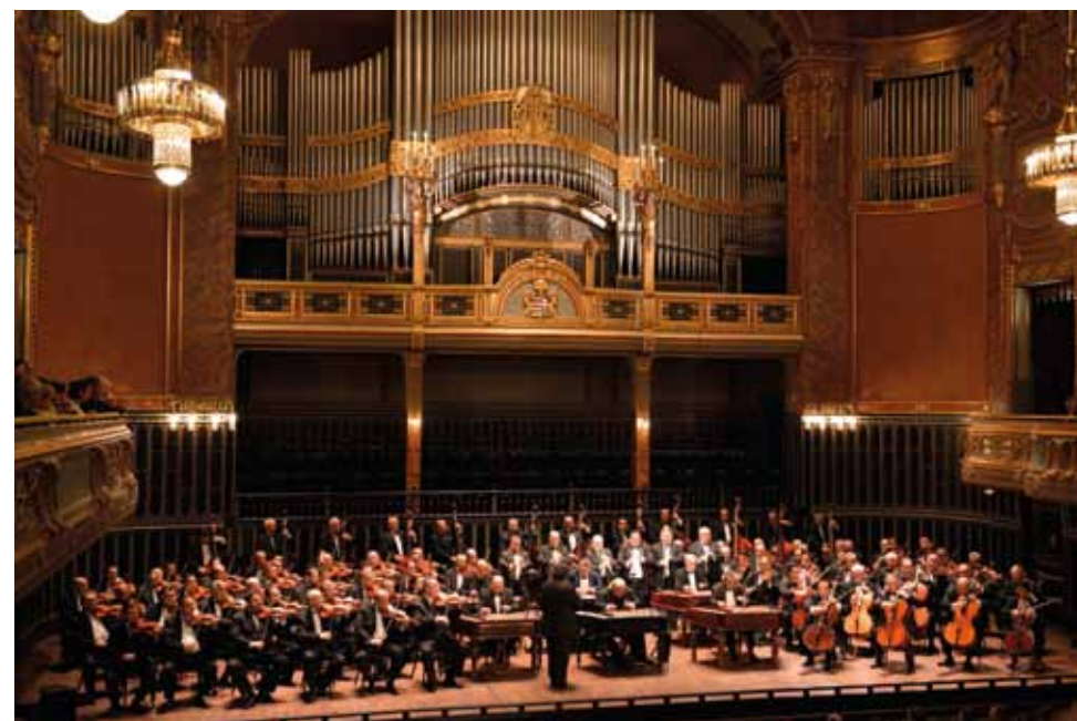
A Száz Tagú Cigányzenekar fennállásának 28. évfordulója alkalmából rendezett jubileumi koncert