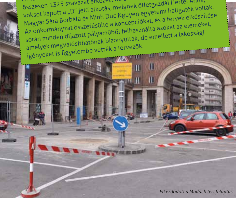
Elkezdődött a Madách téri felújítás