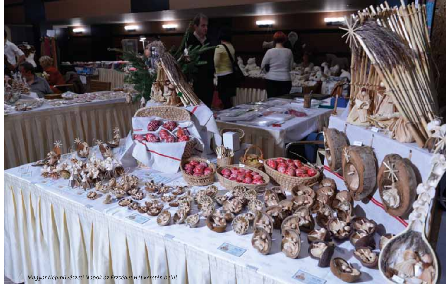
Magyar Népművészeti Napok az Erzsébet Hét keretén belül

Hogy kezdted? Kivitettem a próbababát a kertbe nyáron, és fogtam a kisbaltát, ugyanis neki ötvenöt centis dereka volt! A legendák szerint nyers lóvért ivott, hogy ne hízzon. Ő pontosan tudta, hogy a szépség komoly tényező!